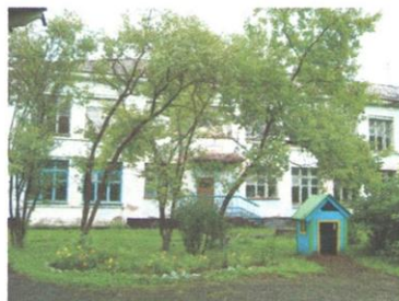
Мдоу №16 г.о.п.Лобва

Данные победили в двух номинациях соответственно: презентация образовательной здоровьесберегающей образовательной программы и презентация отдельных уникальных условий, направленных на сохранение и укрепление физического и психического здоровья детей дошкольного возраста.