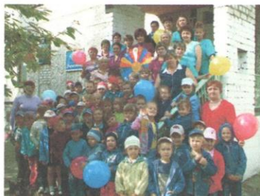
МДОУ №48 г.о.Краснотурьинск

Это Муниципальное дошкольное образовательное учреждение №48 «Вырастайка» г. Краснотурьинска и Муниципальное дошкольное образовательное учреждение №16 «Светлячок» Новолялинского городского округа п. Лобва.