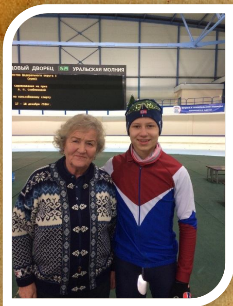
С легендой Российского конькобежного спорта Лидией Скобликовой.